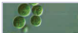
Chlorella pyrenoidosa x 1000