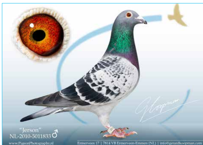
'Jerson' Olympiade duif Cat. (C) Nitra, Slowakije in 2013

Alle eigen uitslagen in detail hier presenteren is overbodig, die zijn genoegzaam bekend en via digitale kanalen beschikbaar. Echter niet onvermeld mogen blijven de recente olympiade duiven 'Jerson' en 'Kyara'