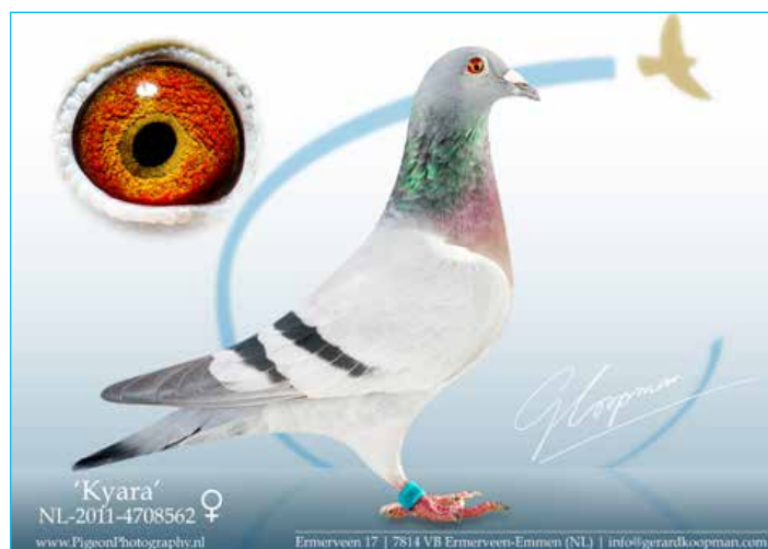
'Kyara' Olympiade duif Cat. (B) Budapest, Hongarije in 2015

Bij andere liefhebbers zijn het ook vaak de Koopman-duiven die echt het verschil maken. Kijk maar eens naar de pedigrees van: