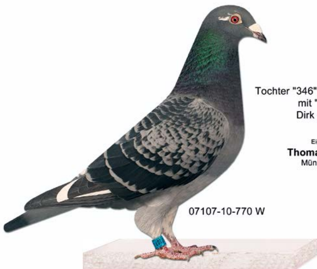
Tochter "346" x Tochter "Gus" mit "NL-105 Dirk de Beer

1. RV-Männchenmeister, drei Tauben 36 Preise 2. RV-Meister, 56 Preise, 3 x 1. Konkurs 5. FG-Meister 5. RegV-Meister Endflug Wien, 10 ges/ 9 Pr.