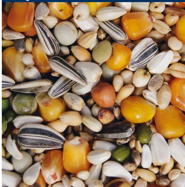
Prange Grand Prix

Beyers „Prange Grand Prix“ ist eine einzigartige hochwertige Mischung, die sehr vielseitig und außerordentlich reich an Nährstoffen und damit ideal für den modernen Taubensport ist. Die Mischung enthält nicht weniger als 21 verschiedene Bestandteile, darunter 25 % Cribbs-Mais und kleiner Cribbs-Mais, 9 % Hanf und exklusive Samen wie Quinoa und Sesam. Mit einem Gehalt von 14,51 % Roheiweiß und von 9,82 % Rohfett bietet Ihnen „Prange Grand Prix“ die Möglichkeit, maximale Leistung aus den Tauben herauszuholen.